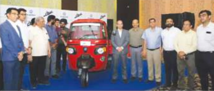
आपे वाहन ईंधन की बचत करने की क्षमता से लैस है। यह हमारे उपभोक्ताओं की जरूरतों को हम अपने उपभोक्ताओं को अपने लिए बेहतरीन वैरिएंट चुनने की आजादी देने में विश्वास रखते हैं।

जयपुर। पियाजियो व्हीकल्स प्राइवेट लिमिटेड (पीवीपीएल), इटली के ऑटो दिग्गज पिजाजियो ग्रुप की 100 फीसदी सहयोग कंपनी और भारत में छोटे कमर्शियल वाहनों की प्रमुख निर्माता कंपनी है। इसने जिवांदिली से भरपुर शहर जयपुर में दो नए सीएनजी ग्री-व्हीलर प्रॉडक्ट्स, आपे एक्सप्लो एलडीएक्स (कार्गो व्हीकल) और आपे मेट्रो (पैसेंजर व्हीकल) को लॉन्च किया है। इन दोनों वाहनों को पियाजियो निर्मित 230 सीसी के नए सीएनजी इंजन से लैस किया गया है। यह 3-वॉल्व की टेकनोलॉजी से लैस अल्युमिनियम से बना हल्के वजन का इंजन है। यह एयर कूल्ड और स्वाभाविक रूप से चलने वाला इंजन अपनी श्रेणी में बेहतरीन माइलेंज प्रदान करता है। साथ ही, यह उच्च दर्जे की क्षमता, रखरखाव की कम लागत, खींचने की उच्च शक्ति और सर्वश्रेष्ठ ड्रा