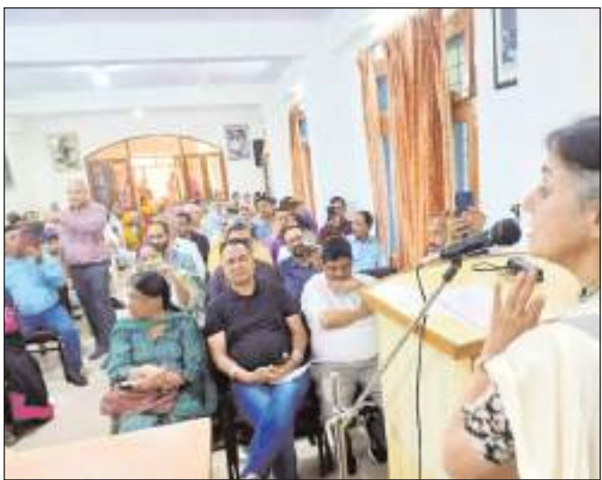
हिमाचल जिसे केरल के बाद सरकारी शिक्षा के लिए सबसे अनुकूल और बेहतर माना जाता था उसने भी केंद्र सरकार के आगे