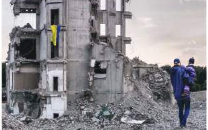
करोड़ों और गांव जलमग्न हो गए हैं तथा यहां से 6,000 से अधिक लोगों को निकालकर सुरक्षित जगहों पर पहुंचाया गया है। यूक्रेन और मॉस्को के अधिकारियों के मुताबिक, बाढ़ में करीब 20 लोगों की मौत हुई है। हालांकि, 30,000 से अधिक लोगों को मानवीय सहायता पहुंचाई है। उन्होंने हालांकि कहा कि रूस ने संयुक्त राष्ट्र को अपने नियंत्रण वाले क्षेत्रों में बाढ़ पीड़ितों को मदद की अनुमति नहीं दी है।

लिया था। अधिकारियों का कहना है कि करोड़ोंका बांध टूटने और उसका पानी नीपर नदी में बहने से तट पर स्थित दर्जनों शहर, स्वतंत्र रूप से इसकी पुष्टि नहीं हो पाई है। ग्रिफिथ्स ने बताया कि संयुक्त राष्ट्र ने यूक्रेन के नियंत्रण वाले बाढ़ प्रभावित क्षेत्रों में