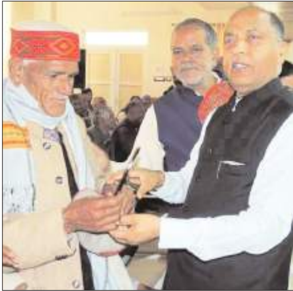
विकास की नई गाथा लिख रहे हैं, दुनिया में भारत का डंका बज