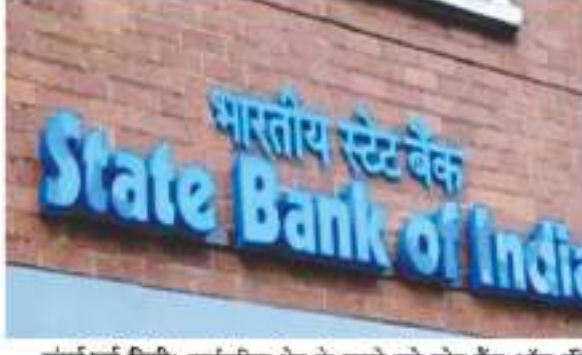
संबंध/नई दिल्ली। सार्वजनिक क्षेत्र के सबसे बड़े स्टेट बैंक ऑफ इंडिया (एसबीआई) वित्त वर्ष 2023-24 में बांड के जरिए भारतीय और विदेशी बाजारों से 50 हजार करोड़ रुपये जुटाएगा। बैंक के केंद्रीय निदेशक मंडल ने इसे मंजूरी दे दी है। स्टेट बैंक ने शेयर बाजार को भी सूचना में कहा कि चालू वित्त वर्ष 2023-24 में बैंक बांड के जरिए भारतीय और विदेशी बाजारों से 50 हजार करोड़ रुपये जुटाएगा। इस संबंध में बैंक के केंद्रीय निदेशक मंडल ने मंजूरी दी है। एसबीआई ने बताया कि निदेशक मंडल ने बांड जारी कर रुपये या किसी अन्य परिवर्तनीय मुद्रा में धन जुटाने की मंजूरी दी है। उल्लेखनीय है कि स्टेट बैंक का बीते वित्त वर्ष 2022-23 की (जनवरी-मार्च) चौथी तिमाही में एकीकृत शुद्ध लाभ लगभग 90 फीसदी की वृद्धि के साथ 18,094 करोड़ रुपये था।

नई दिल्ली। आर्थिक संबंधों को मजबूत करने के लिए उनके साथ मुक्त व्यापार समझौते (एफटीए) को लेकर वार्ता करने में दिलचस्पी दिखाई है। केंद्रीय वाणिज्य एवं उद्योग मंत्री पीयूष गोयल ने यहां अफ्रीका के 15 देशों के राजदूतों के साथ एफटीए को लेकर बैठक की। वाणिज्य एवं उद्योग मंत्रालय ने शुक्रवार को यह जानकारी दी। मंत्रालय के मुताबिक पीयूष गोयल ने इस बैठक के बाद कहा कि भारत अफ्रीकी देशों के साथ अलग से या अफ्रीका के साथ संयुक्त रूप से द्विपक्षीय या सामूहिक एफटीए पर बातचीत करने को तैयार है। अफ्रीका के साथ व्यापार, वाणिज्य, कारोबार, निवेश और अवसर पैदा करने में