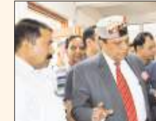
को उनके घर द्वार के निकट बेहतर व नवीनतम स्वास्थ्य सुविधाएं उपलब्ध कराने के लिए प्रदेश सरकार द्वारा अनेक कदम उठाए जा रहे हैं जिसके तहत प्रत्येक विधानसभा क्षेत्र में एक एक उत्कृष्ट स्वास्थ्य संस्थान स्थापित किया जाएगा जहां मरीजों