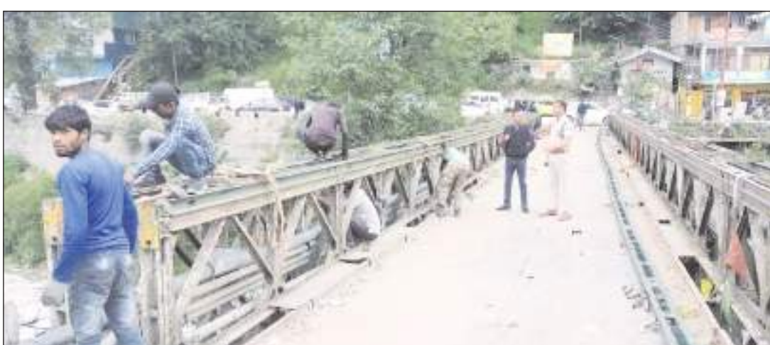
कोलकाता से गार्डन रिच शिप बिल्डर्स इंजिनियरस द्वारा तैयार किया गया है।