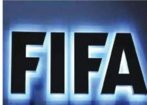
फीफा ने कहा कि यह पहल को एक उचित सौदा सुनिश्चित

195,000 यू एस डॉलर दिये जाएंगे। महिलाओं के फुटबॉल को विकसित करने और खिलाड़ियों को एक उचित सौदा सुनिश्चित करने की ओर एक और ठोस कदम है। फीफा अध्यक्ष जियानी इन्फेन्टिने ने कहा, इस अभूतपूर्व नए वितरण मॉडल के तहत, फीफा महिला विश्व कप 2023 में हिस्सा ले रही प्रत्येक महिला खिलाड़ी व्यक्तिगत रूप से पारिश्रमिक पर भरोसा कर सकती है। भाग लेने वाले प्रत्येक सदस्य संघ को कम से कम 1.56 मिलियन अमेरिकी डॉलर मिलेंगे, और विजेताओं को 4.29 मिलियन अमेरिकी डॉलर वितरित किए जाएंगे। फीफा के अनुसार, फीफा महिला विश्व कप 2023 में इसका कुल निवेश 500 मिलियन अमेरिकी डॉलर से अधिक होने का अनुमान है।