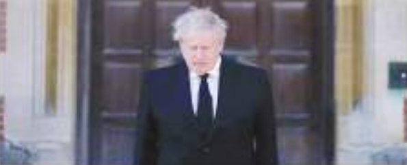
मिलने के बाद जॉनसन ने शुरूआत को अपने इस्तीफे की घोषणा की। है। आपको बता दें कि इसी साल मार्च में विशेषाधिकार समिति को

लंदन। ब्रिटेन के पूर्व प्रधानमंत्री बोरिस जॉनसन ने पार्टीगेट कांड पर संसदीय समिति की जांच रिपोर्ट आने के बाद संसद की सदस्यता से इस्तीफा दे दिया है। उनके इस फैसले ने सभी को चौंका दिया है। संसदीय समिति ने अपनी जांच में प्रधानमंत्री पद रहने के दौरान लोकडाउन नियमों का उल्लंघन कर पार्टी करने पर संसद को गुमराह करने के लिए उन पर प्रतिबंध लगाने की सिफारिश की है। संसदीय समिति 58 वर्षीय जॉनसन पर लगे आरोपों की जांच कर रही थी कि क्या उन्होंने कोविड महामारी के दौरान डाउनिंग स्ट्रीट में लोकडाउन नियमों का उल्लंघन कर पार्टी करने के बारे में हाउस ऑफ कॉमन्स (ब्रिटिश संसद) को गुमराह किया था। विशेषाधिकार समिति से मामले पर गौपनीय पत्र