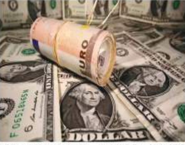
विदेशी मुद्रा भंडार 4.34 अरब डॉलर की गिरावट के साथ 589.14 अरब डॉलर रह गया था। आंकड़ों के मुताबिक विदेशी मुद्रा भंडार का सबसे अहम घटक विदेशी मुद्रा परिसंपत्तियां भी

नई दिल्ली। आर्थिक मंत्रालय ने अचूरी खबर अहम है। देश का विदेशी मुद्रा भंडार 2 जून को समाप्त होने में 5.929 अरब डॉलर उछलकर 595.067 अरब डॉलर हो गया। इससे पहले लगातार दो हफ्ते विदेशी मुद्रा भंडार में गिरावट दर्ज हुई थी। रिजर्व बैंक ऑफ इंडिया (आरबीआई) ने जारी आंकड़ों में यह जानकारी दी है। आरबीआई ने जारी आंकड़ों में बताया कि दो जून को समाप्त होने में विदेशी मुद्रा भंडार 5.929 अरब डॉलर बढ़कर 595.067 अरब डॉलर हो गया है। इससे पिछले हफ्ते 26 मई को समाप्त होने में देश का कुल विदेशी मुद्रा भंडार 4.34 अरब डॉलर की गिरावट के साथ 589.14 अरब डॉलर रह गया था। आंकड़ों के मुताबिक विदेशी मुद्रा भंडार का सबसे अहम घटक विदेशी मुद्रा परिसंपत्तियां भी 5.27 अरब डॉलर बढ़कर 526.201 अरब डॉलर हो गईं। इसी तरह स्वर्ण भंडार का मूल्य 65.5 करोड़ डॉलर बढ़कर 45.557 अरब डॉलर हो गया है। हालांकि, इस दौरान विशेष अहरण अधिकार (एसडीआर) 60 लाख डॉलर फिसलकर 18.186 अरब डॉलर रह गया। इसके अलावा अंतरराष्ट्रीय मुद्रा कोष (आईएमएफ) में रखा देश का मुद्रा भंडार एक करोड़ डॉलर बढ़कर 5.123 अरब डॉलर हो गया। उल्लेखनीय है कि अक्टूबर, 2021 में देश का विदेशी मुद्रा भंडार बढ़कर 645 अरब डॉलर के रिकॉर्ड उच्चतम स्तर पर पहुंच गया था।